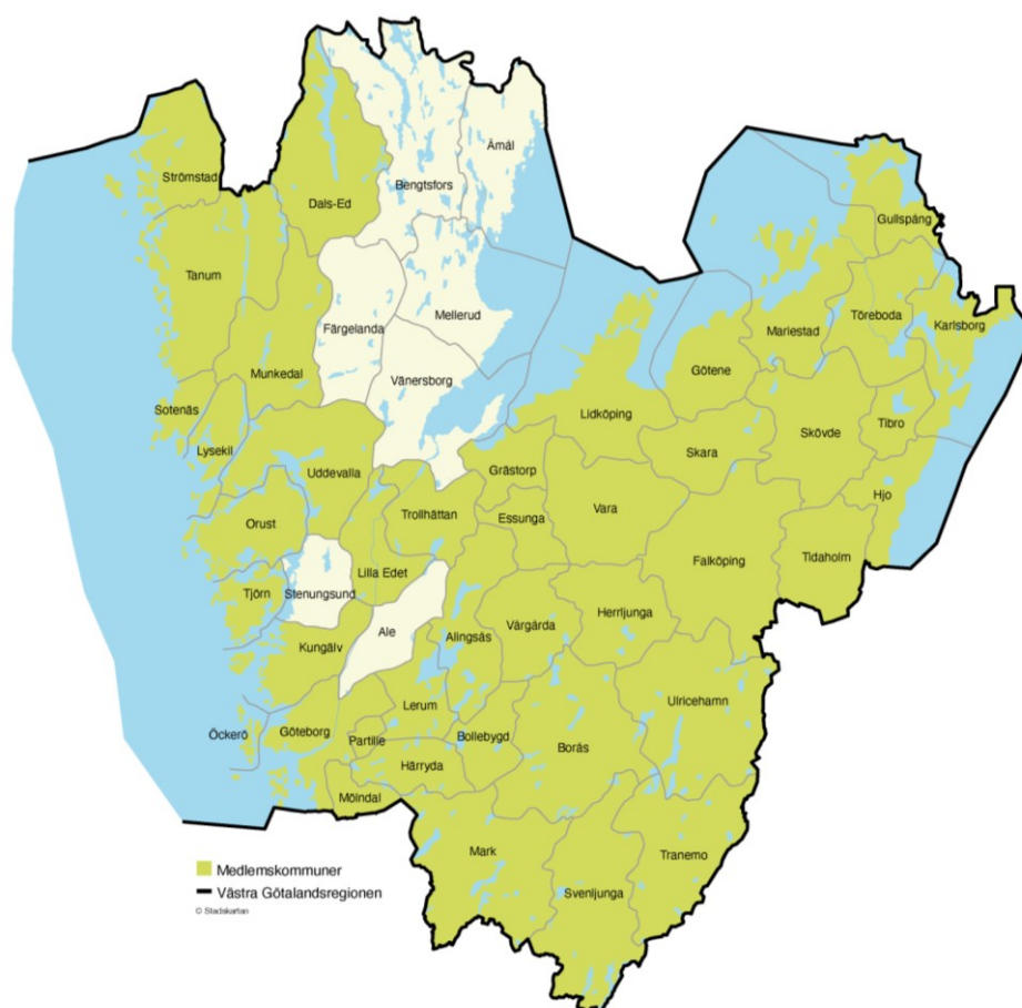
Figur 1 Karta över medlemskommuner

Tolkförmedling Väst har varit i drift sedan 1 april 2013 och består av totalt 43 medlemmar; Västra Götalandsregionen samt kommunerna Alingsås, Bollebygd, Borås, Dals-Ed, Essunga, Falköping, Grästorp, Gullspång, Göteborg, Götene, Herrljunga, Hjo, Härryda, Karlsborg, Kungälv, Lerum, Lidköping, Lilla Edet, Lysekil, Mariestad, Mark, Munkedal, Mölndal, Orust, Partille, Skara, Skövde, Sotenäs, Strömstad, Svenljunga, Tanum, Tibro, Tidaholm, Tjörn, Tranemo, Trollhättan, Töreboda, Uddevalla, Ulricehamn, Vara, Vårgårda och Öckerö.